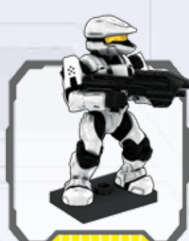
UNSC Spartan Scout - Scout Spartan CENU Spartan éclaireur du CSNU - RVN Scout Spartan RVN Scout Spartan - Scout Spartan del CSNU Spartan Scout CENU