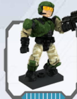
UNSC Marine - Marine CENU - Marine du CSNU RVN Marine - RVN-marinier Infante de marina del CSNU - Fuzileiro da CENU