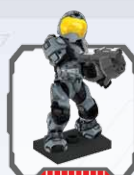
UNSC Spartan Security - Seguridad Spartan de CENU Spartan de sécurité du CSNU - RVN Spartan Sicherer RVN Spartan-beveiligiger CSNU Spartan di Sicurezza Segurança Spartan da CENU