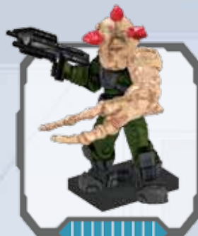
Flood Combat Form - Forma de combate Flood Forme de combat Flood - Flood-Kampfgebilde Flood Combat Form - Forma Combat Flood Forma de Combate Flood