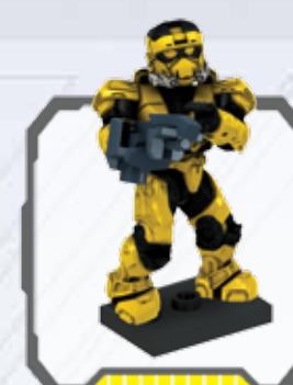
UNSC Spartan EOD - EOD Spartan de CENU Spartan EOD du CSNU - RVA Spartan EOD RVA EOD-Spartan - CSNU Spartan EOD Spartan EOD da CENU