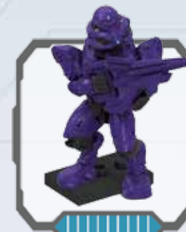
Covenant Elite Commando - Commando Covenant Elite Commando Élite du Covenant - Kommando Covenant Elite Covenant Elite-commando - Comando Elite de Covenant Comando Elite Covenant