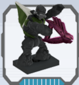
Covenant Grunt - Covenant Grunt Grognard Covenant - Covenant Grunt Covenant-grunt - Covenant Grunt Rame Soldado Grunt Covenant