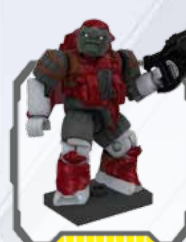
Covenant Brute Jump Pack - Paquete de lanzamiento de Covenant Brute Équipement de saut de Brute du Covenant - Covenant Brute Sprungpaket Covenant Brute met jetpack - Covenant Brute Jump Pack Mochila de Salto Covenant Brute