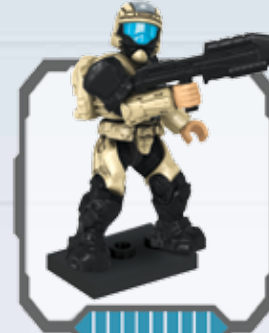
UNSC ODST - ODST de CENU - ODST du CSNU RVN ODST - RVN-ODST CSNU ODST - ODST da CENU