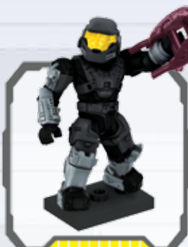
UNSC Spartan Mark V - Mark V Spartan de CENU Spartan Mark V du CSNU - RVA Spartan Mark V RVA Mark-V-Spartan - CSNU Spartan Mark V Spartan Mark V da CENU