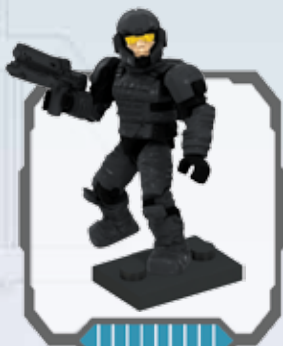
UNSC Marine - Marine CENU - Marine du CSNU RVN Marine - RVN-marinier Infante de marina del CSNU - Fuzileiro da CENU