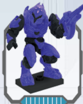
Covenant Elite Zealot - Covenant Zealot Elite Élite zélate du Covenant - Covenant Zealot Elite Covenant Zealot Elite - Elite Zealot de Covenant Elite Zealot Covenant