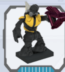
Covenant Grunt - Covenant Grunt Grognard Covenant - Covenant Grunt Covenant-grunt - Covenant Grunt Rame Soldado Grunt Covenant

16 MICRO ACTION FIGURES TO COLLECT! FIGURAS DE ACCIÓN EN MINIATURA PARA COLECCIONAR! FIGURINES ARTICULÉES À COLLECTIONNER! MICRO-ACTIONFIGUREN ZUM SAMMELN! ACTIEFIGUURTJES OM TE VERZAMELEN! PERSONAGGI DA COLLEZIONARE! MICRO FIGURAS DE AÇÃO PARA COLETAR! ZBIERZ MIKRO FIGURKI BOHATERÓW!