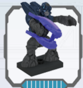
Covenant Grunt Spec Ops - Grunt operaz. speciali Covenant Grunt des opérations spéciales du Covenant Covenant Spezialeinsatz Grunt - Covenant Special Ops-grunt Grunt de Operaciones Especiales de Covenant Grunt das Operações Especiais Covenant

ULTRA RARE ULTRA RARE ULTRA RARE EXTREM SELTEN ZEER ZEELDZAAM MOLTO RARO ULTRA RARO