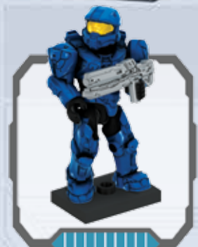
UNSC Spartan Mark VI - Spartan Mark VI de CENU Spartan Mark VI du CSNU - RVN Spartan Mark VI RVN Spartan Mark VI - Spartan Mark VI CSNU Spartan Mark VI CENU